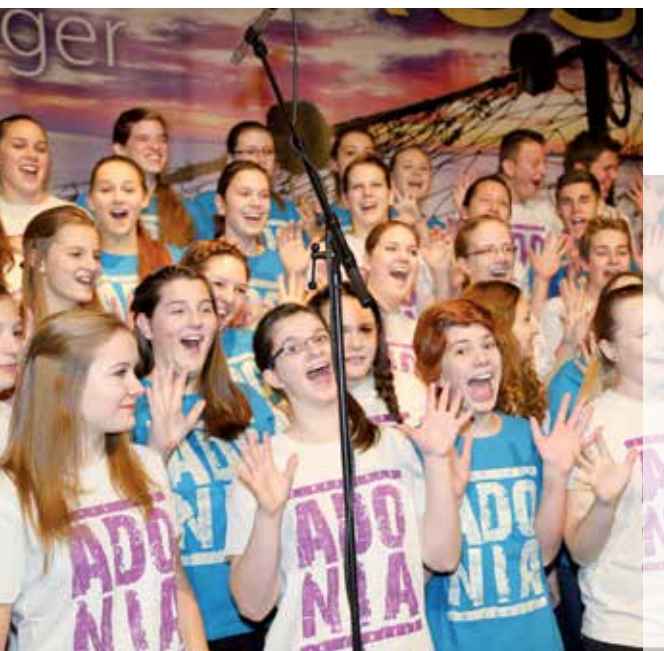
Adonia-Konzert am 26. April 2014. Gastgeber für Adonia-Teens gesucht. Mehr auf www.refgossau.ch

Neben Erfahrungsberichten von Personen aus unserer Gemeinde, welche sich für Osteuropa einsetzen (Osteuropamission und Cevi-Einsätze in Bulgarien) und ein paar Worte von Juzis über ihre Zeit in Zentral-Asien, soll auch Platz sein für den persönlichen Austausch