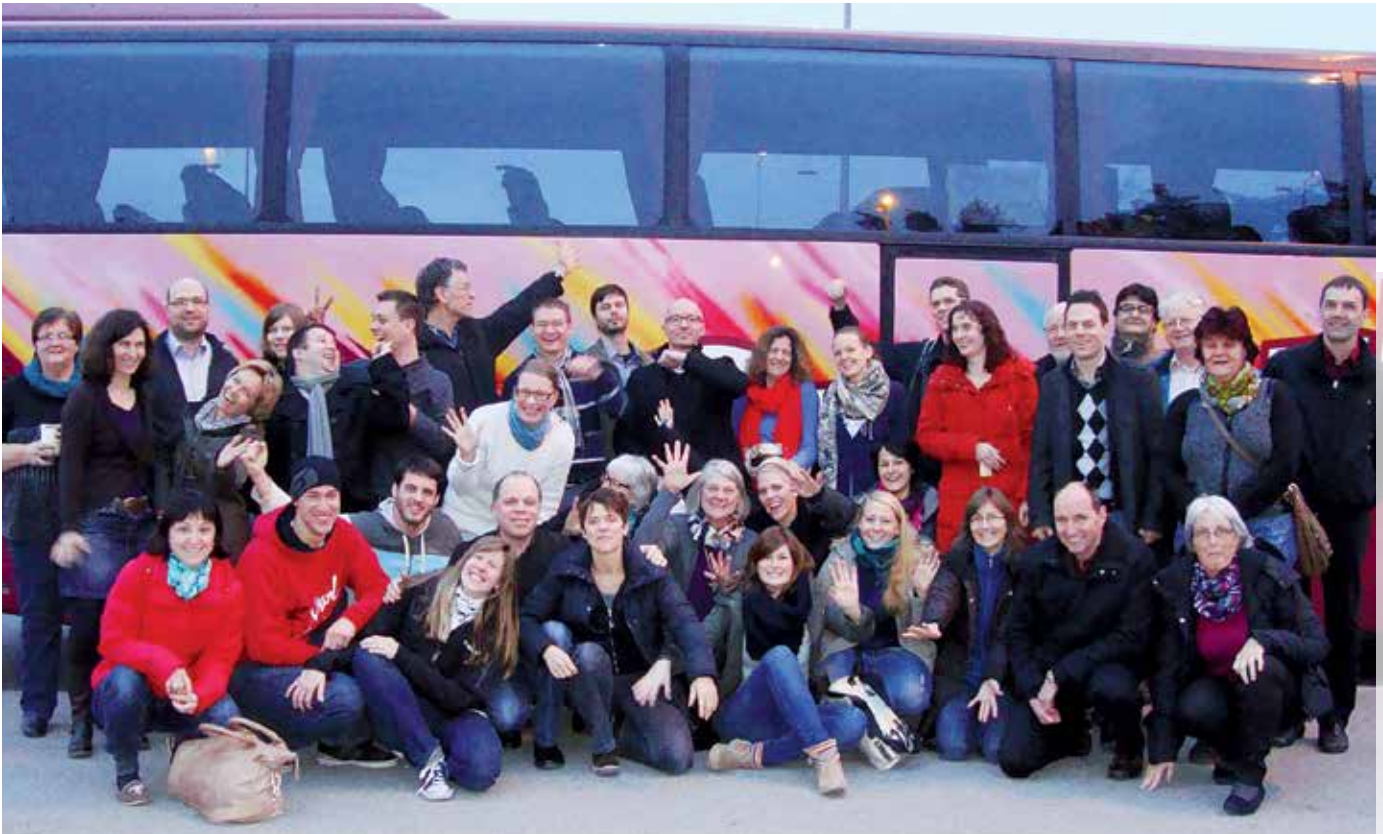
Die 9-stündige Carfahrt an die Leiterschaftskonferenz in Leipzig gestaltete sich kurzweilig.