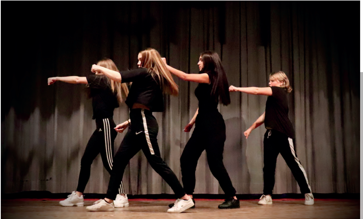
Cevi und Kirche bauen an «Schulterschluss».