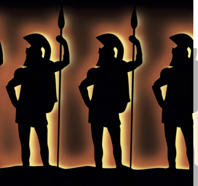
Ostergarten 5. bis 22. April 2019 im KGH.