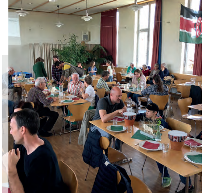
Kawaida-Lunch 2018